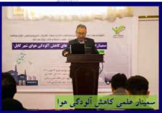
سمینار علمی کاهش آلودگی هوا