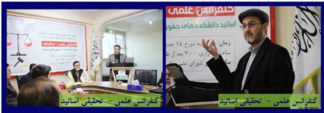
کنفرانس علمی - تحقیقی اساتید